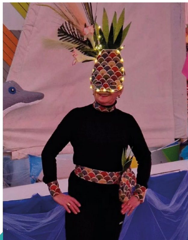
2 ÈME PRIX L'ANANAS CATHERINE