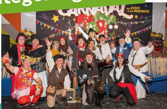
2 ÈME PRIX LA GUILDE DE BEL AIR