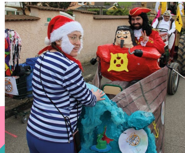
1 ER PRIX LE PAYS IMAGINAIRE DE L'ASSOCIATION DES GONES ET DES MOINEAUX