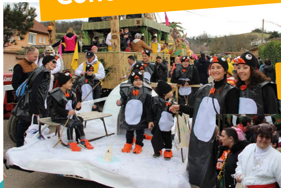
1 ER PRIX LA MARCHÉ DES EMPEREURS FAMILLE NAIDEAU, PLANTIER