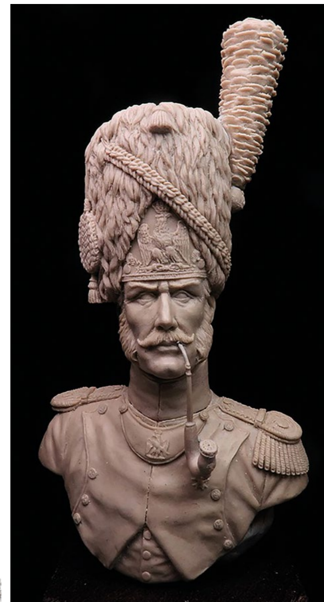
Sculpture J.V. RIGODIN

Nous vous accueillerons avec plaisir. N'hésitez pas à naviguer sur notre site, toutes les photos sont disponibles et peuvent être téléchargées : www.lugdunum-figurines.com