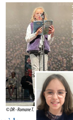
© Progrès Olivier PHILIPPE - Léna M.

Tous les enseignants, ses camarades et la municipalité la soutiennent !