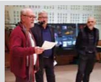
Zoom sur l'Expo-Photo L'exposition du Club Photo a une nouvelle fois bénéficié d'un grand succès auprès du public le week-end des 10 et 11 novembre. Nous félicitons tous les exposants !