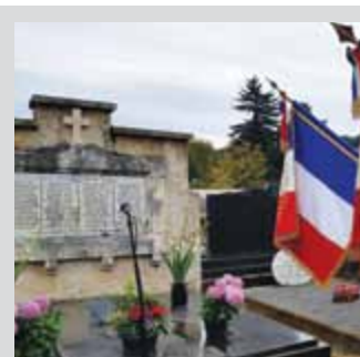
Cérémonie du 1 er novembre Les anciens combattants, les élus de la commune et la population ont défilé vendredi 1 er novembre de la place Charles de Gaulle jusqu'au cimetière pour rendre hommage aux soldats morts pour la France et commémorer dans le recueillement cette cérémonie.