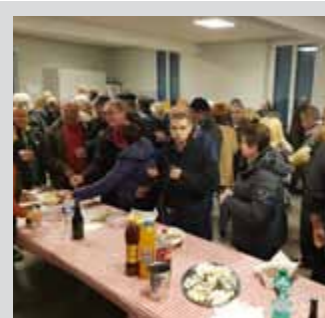
Le Beaujolais nouveau toujours à la fête Le 3 ème jeudi de novembre est bien le rendez-vous des amateurs de Beaujolais nouveau ! Cette année encore, les amoureux du bon pain, du saucisson, des grattons et évidemment du Beaujolais, ont été nombreux à répondre présents pour ce rendez-vous de la convivialité. Un très bon moment de partage qui a attiré plus de 200 personnes !